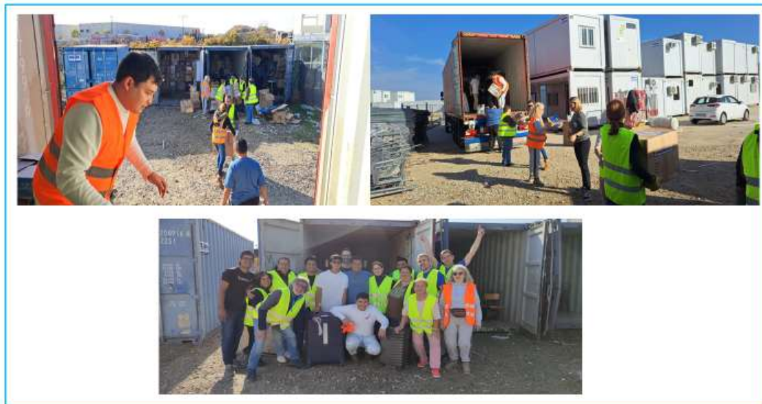
Carga de contenedor 30 de noviembre de 2024.